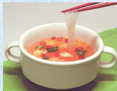
春雨キムチスープ 4食入り ¥499