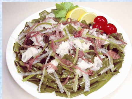
海藻サラダ 100g ¥499

季節の野菜と盛り合わせてヘルシーサラダ!お刺身の付け合わせ!うどん・ラーメンにはそのままトッピング!食卓に海の香り