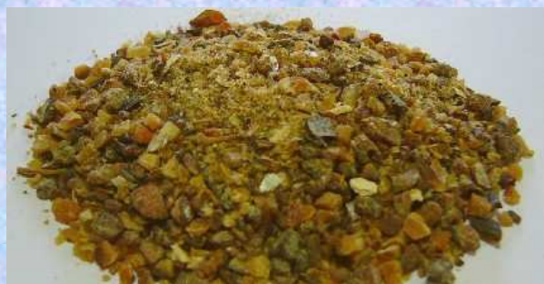
原材料表示・風味原料（鯖・煮干し・鰹・椎茸・昆布） 調味料（アミノ酸等）（原材料の一部に小麦を含む）