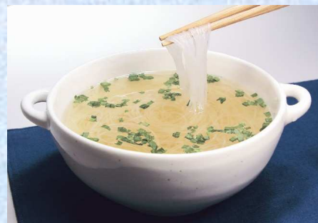
はるさめスープ 5食入り ¥499