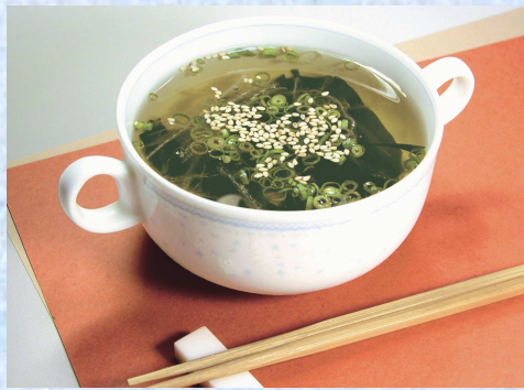
寒天スープ 7食入り ¥499